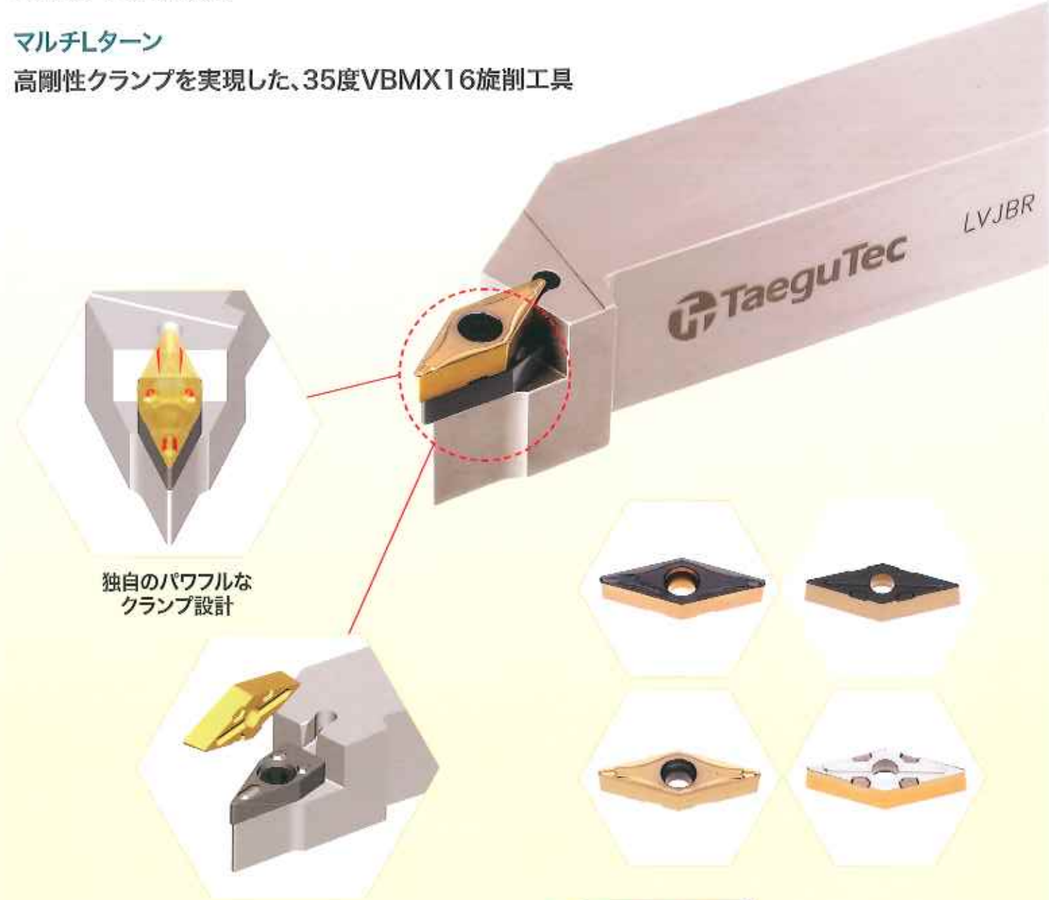
独自のパワフルなクランプ設計